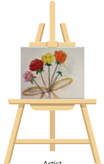
Artist Anshika Gadiya -VI-C

Answer key: 1. name/mane 2. capes/space 3. meat/team 4. weird/wider 5. east/seat 6. garden/danger 7. large/glare 8. please/asleep 9. sale/seal 10. liar/lair