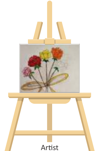
Artist Anshika Gadiya -VI-C

Answer key: 1. name/mane 2. capes/space 3. meat/team 4. weird/wider 5. east/seal 6. garden/danger 7. large/glare 8. please/asleep 9. sale/seal 10. liar/lair