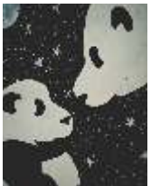
Artist Sajit Jangid XII-E

A day will come when nature gets its real beauty again. A day will come when every human will have sharp brain. A day will come when discrimination, creed, and greed will drain. A day will come when all will look after their health, And there will be no dearth of wealth.